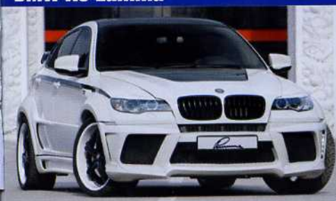
BMW X6 Manhart Racing