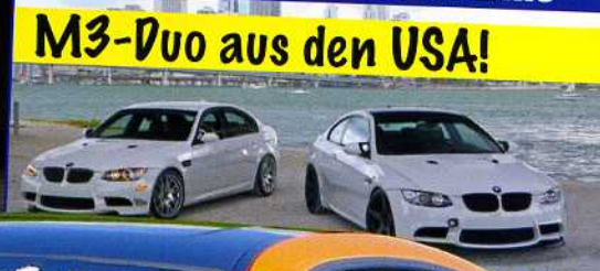
M3-Duo aus den USA!