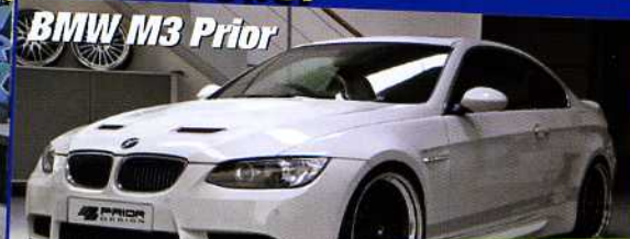
BMW M3 Prior