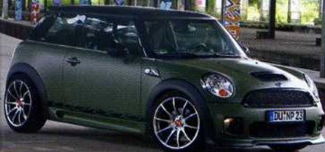
Mini Cooper Nowack