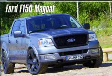
Ford F150 Magnat