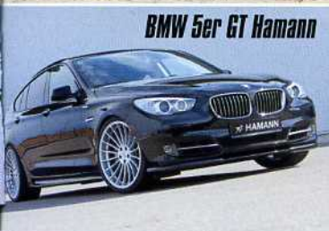
BMW 5er GT Hamann