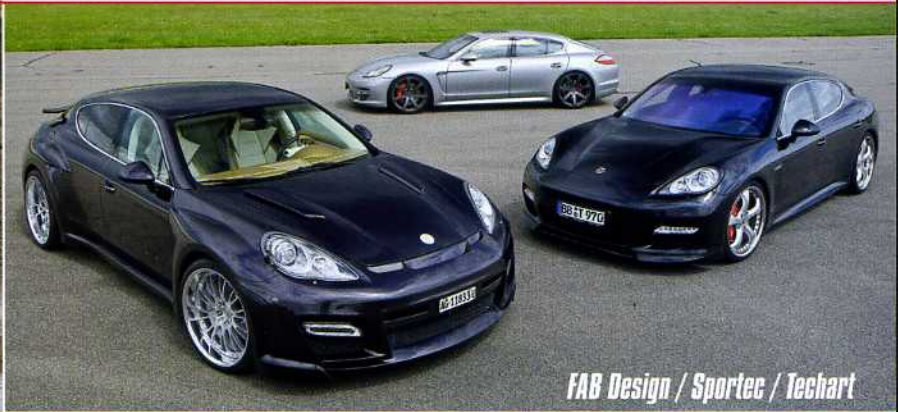
FAB Design / Sportec / Techart

TUNING WORLD BODENSEE + TUNING EXPO SAARBRÜCKEN + BMW INTERNET SHOP