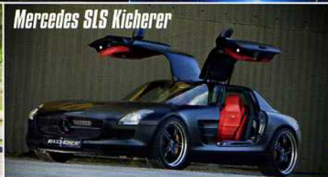
Mercedes SLS Kicherer