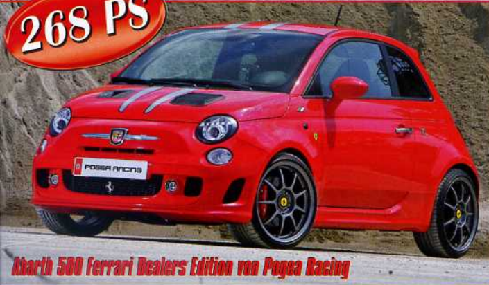
Karch 500 Ferrari Dealers Edition von Peugeot Racing