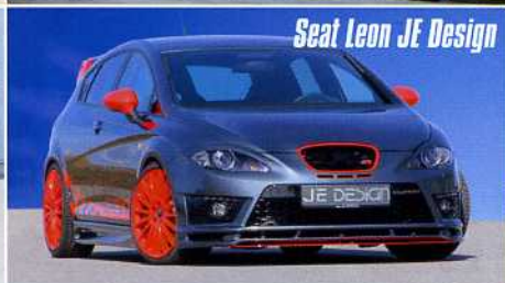
Seat Leon JE Design